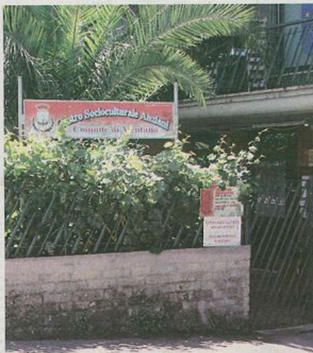
Il circolo di via Giolitti è stato commissariato un anno fa